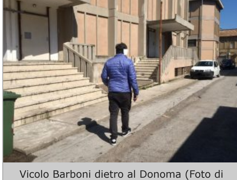
Vicolo Barboni dietro al Donoma