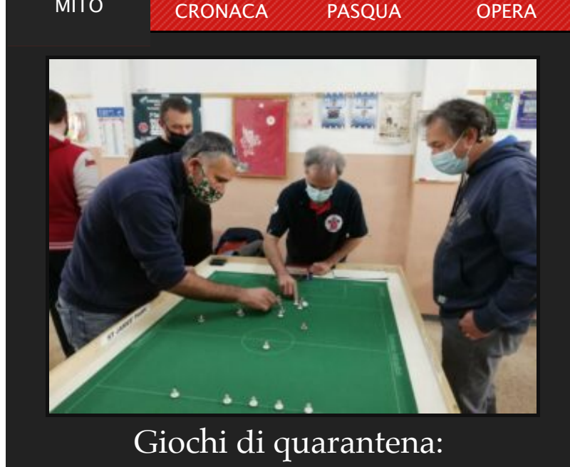
Giochi di quarantena: dalle soffite ritorna il Subbuteo